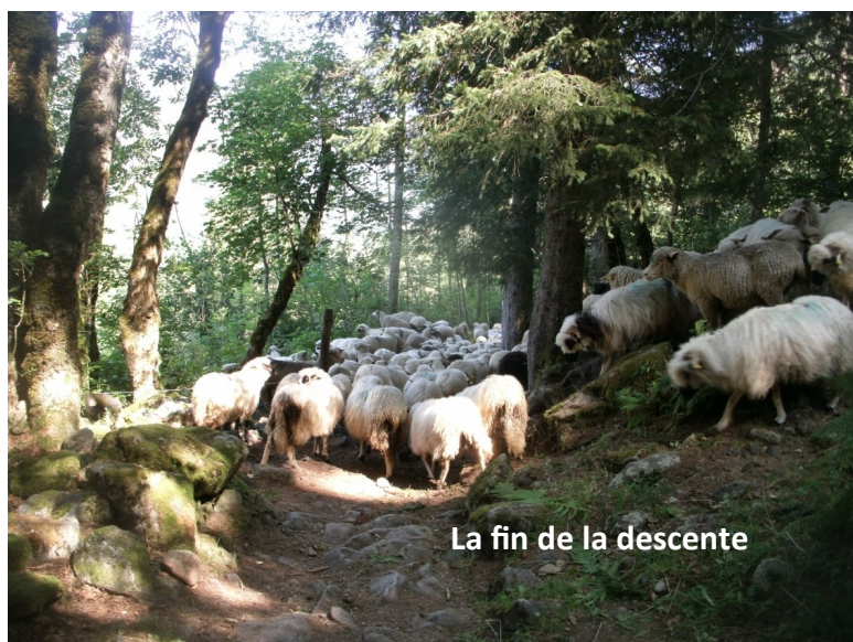
La fin de la descente

Les brebis vont retrouver les béliers. Quant aux agneaux, ils sont à disposition de celles et ceux qui voudront se régaler.