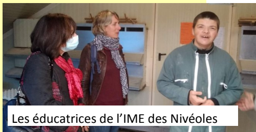
Les éducatrices de l'IME des Nivéoles

Nous avons également eu la visite de deux éducatrices spécialisées de l'IME Les Nivéoles de Voiron. Elles sont venues nous rencontrer car elles encadrent Anaëlle qui est accueillie au bercail tous les vendredis matins.