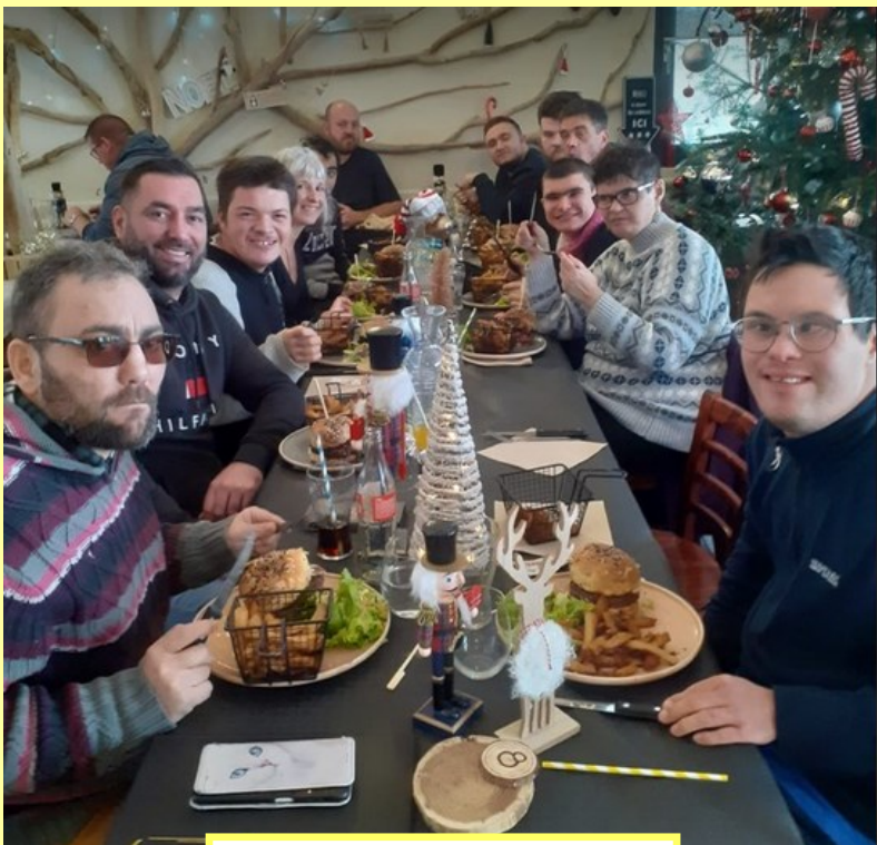
Le groupe du jeudi au resto